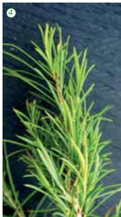
1 Manuka – Leptospermum scoparium 2 Zitronengras – Cymbopogon citratus 3 Thymian – Thymus vulgaris 4 Teebaum – Malaleuca alterifolia

Ätherische Öle wirken gegen aggressive Parodontitiserreger wie Aggregatibacter , Porphyromonas und Prevotella , aber auch gegen die gefürchteten MRSA–Methicillin-resistente Staphylococcus aureus-Stämme . Gegen MRSA hat sich Teebaumöl ( Melaleuca alternifolia ) als besonders wirksam erwiesen 2 . Nach den bisherigen klinischen Erfahrungen eignen sich ätherische Öle außerdem für die Therapie von Erkrankungen der Atemwege, der Haut und des Vaginalbereichs.